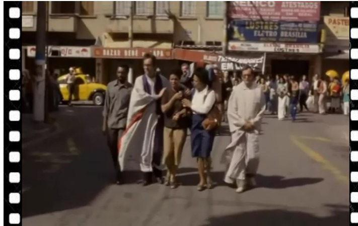
Figura 1, cortejo funerário e protesto

O Plano Geral , também chamado de câmera aberta, permite ter o personagem como foco central. Isto não quer dizer que este precisa estar no centro da cena, aparecendo de corpo inteiro. Permite-se ainda visualizar o cenário ao redor e até mesmo outros personagens envolvidos na cena.