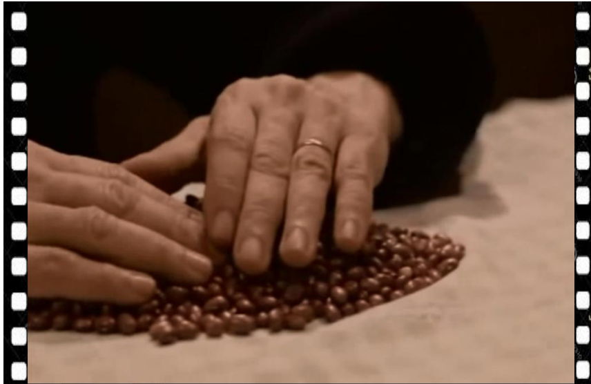
Figura 4, Romana em um momento de contabilização das perdas pela repressão durante a greve

O Plano de Detalhe é facilmente confundido com o Close , no entanto, ele consiste em focar uma parte da personagem ou da cena, que consiste em um pequeno detalhe que funciona com elemento essencial para ressaltar determinada ação dentro do filme foca principalmente em alguma parte do corpo, como exemplo, as mãos