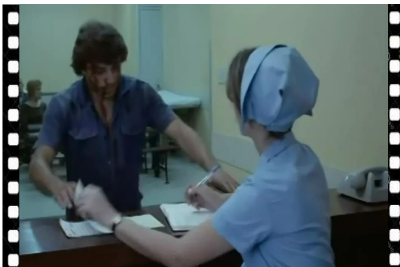
Figura 3, Tião após o protesto em busca de Maria Fonte HIRSZMAN, 1981, cena: 01:32:10

No Plano Americano é mostrado apenas do joelho para cima. Isto permite uma melhor percepção para os detalhes. A saber: posição de mãos, cabeça, algo que a personagem oculta. Ou algo que a personagem esteja realizando, mas que as pernas não fazem diferença na expressão, pois a intenção do recurso é destacar um acontecimento, que dependerá do espectador identificar, não necessita da expressão verbal, pois a imagem automaticamente possibilita identificar o ocorrido.